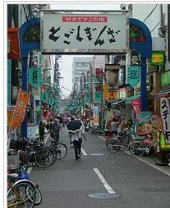
戸越銀座駅から見た「戸越銀座商店街(中央街)」のアーチ